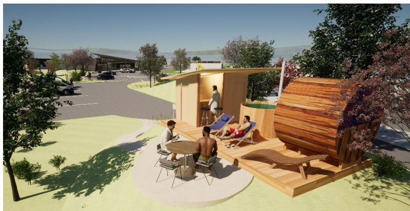
くつろぎ空間に設置するバレルサウナイメージ