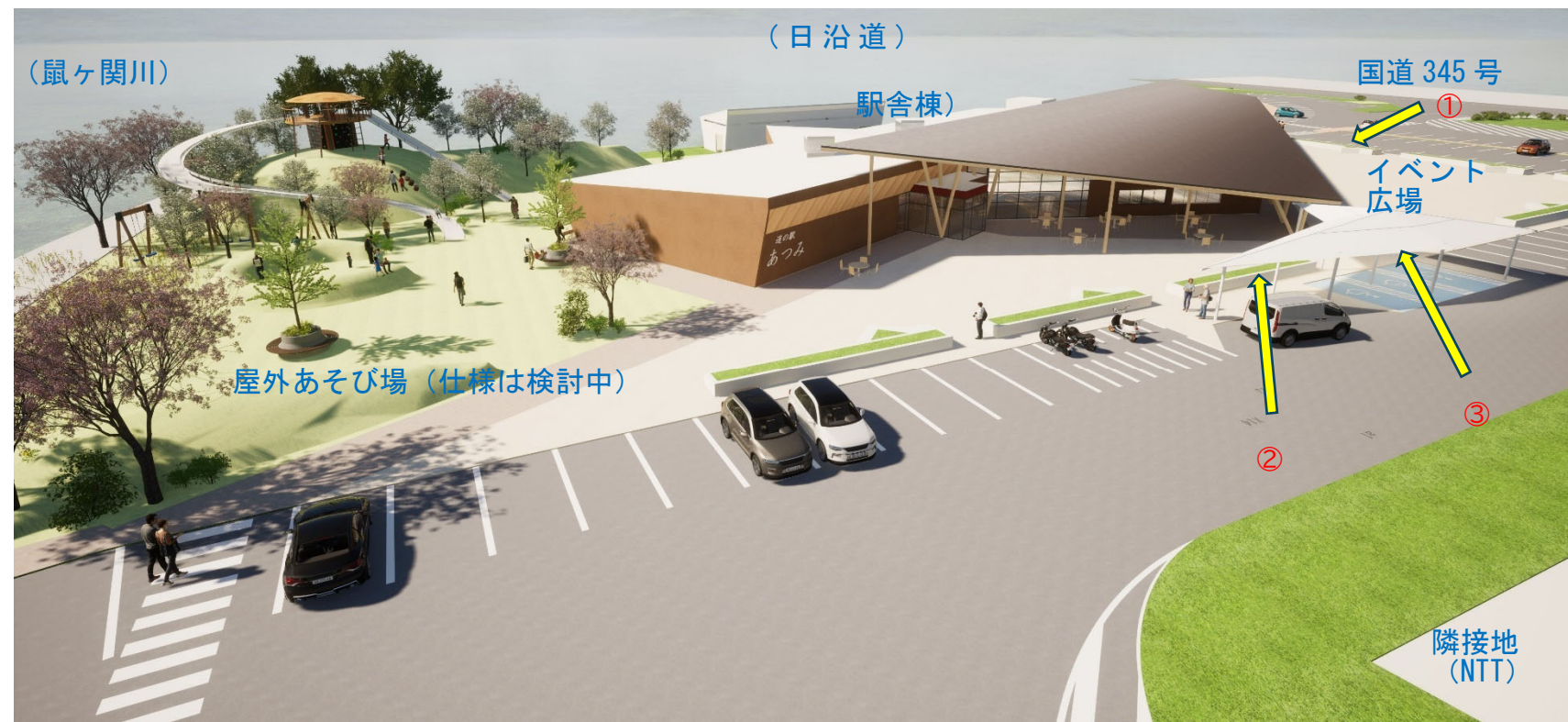
国道7号出入口付近から駅舎を俯瞰する