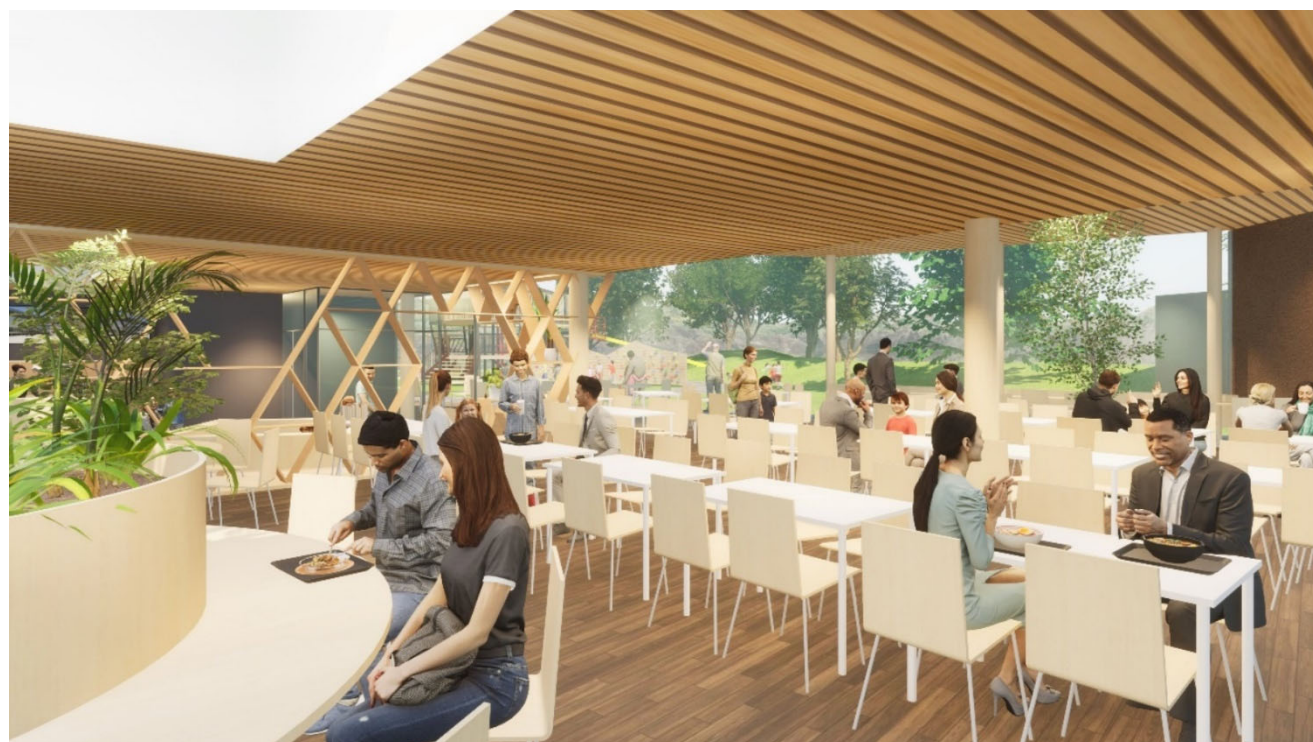
駅舎フードコートイメージ 正面奥に屋外あそび場を見通す