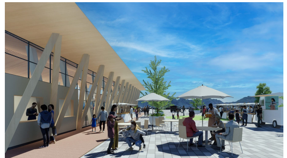
③ イベント広場イメージ 左にファストフード販売窓口 キッチンカーやパラソル付き休憩テーブルが並ぶ