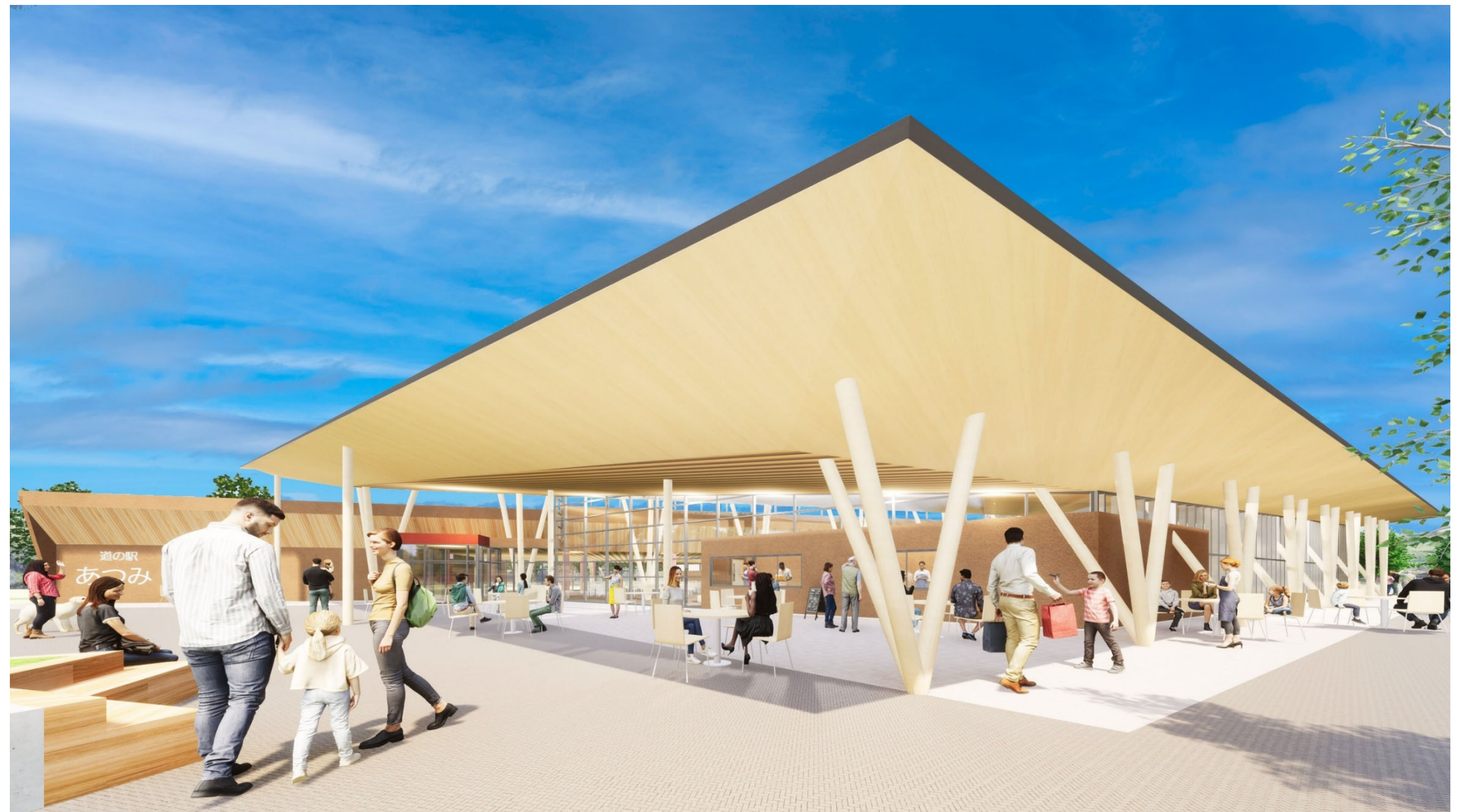
② 駅舎屋根付き広場をイベント広場側からみる 左奥に駅舎低層棟