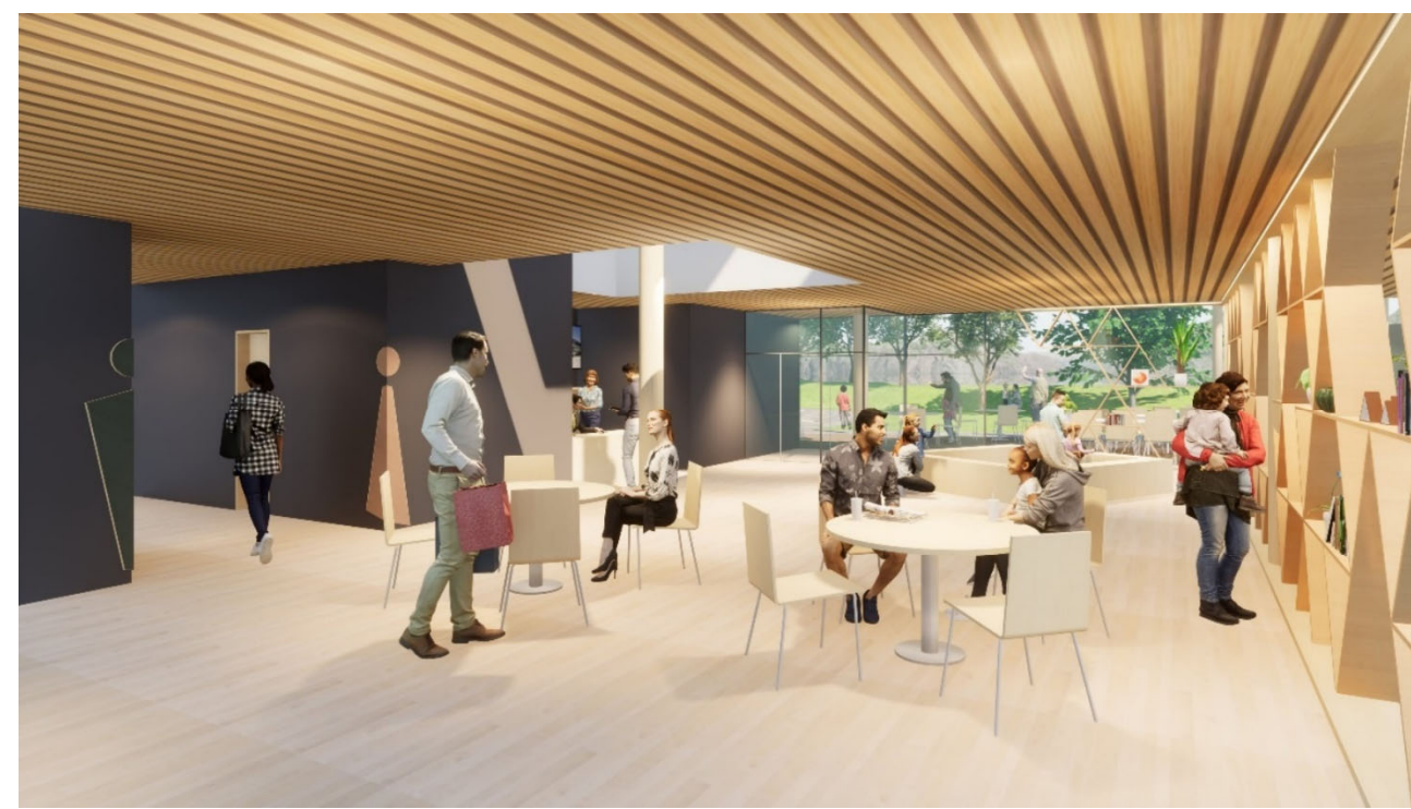
駅舎情報コーナーイメージ 左手に奥に24時間利用WCや授乳室等