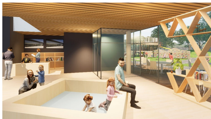
駅舎子ども休憩スペース 左正面に見守りを兼ねた案内コーナー 右手外部が屋外あそび場

*本資料は基本設計時のイメージで、今後の詳細設計により、多少調整される場合があります