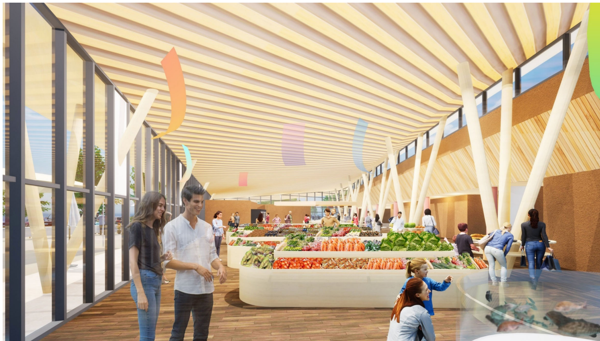
駅舎産直物販スペースイメージ 左手外部がイベント広場 天井や壁の一部に鶴岡市産杉材を活用