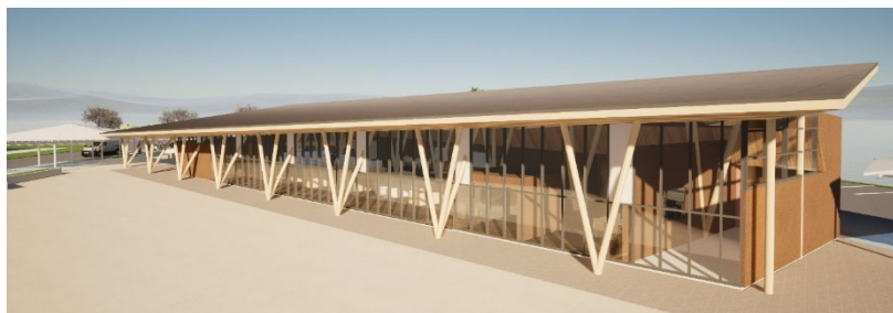
① イベント広場から見た駅舎全景イメージ

*本資料は基本設計時のイメージで、今後の詳細設計により、多少調整される場合があります